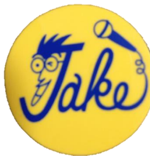
多摩 HH と川崎 HH の みなさまの感想