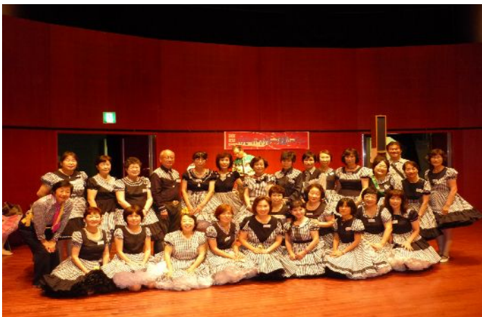
合同パーティー参加人数

私自身、身内のパーティーという気安さもあり、リラックスして踊れました。ちょっぴり自信がついた1日でした。